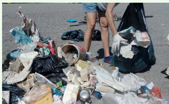
Residuos recogidos en la playa