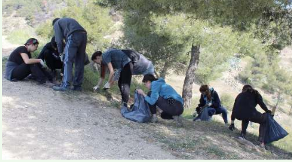
Voluntarios recogiendo residuos

Visibilidad y comunicación. El ejemplo es una buena fórmula de sensibilización , es importante que se conozca vuestra iniciativa, buscar aliados y más participantes. Además, incluso si no se suman más personas tu ejemplo seguro que remueve alguna consciencia.