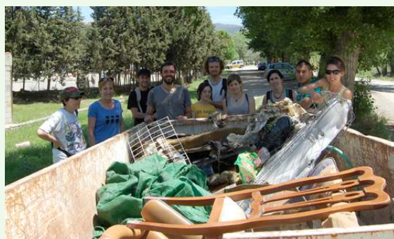
Contenedor solicitado para retirada de residuos

Destino de lo recogido. Cada cosa a su sitio, hay que tener previsto de antemano dónde vamos a llevar lo recogido, dónde hay contenedores, cómo vamos a llevarlos hasta allí. En esto lo mismo tu Ayuntamiento puede ayudarte, consúltales.