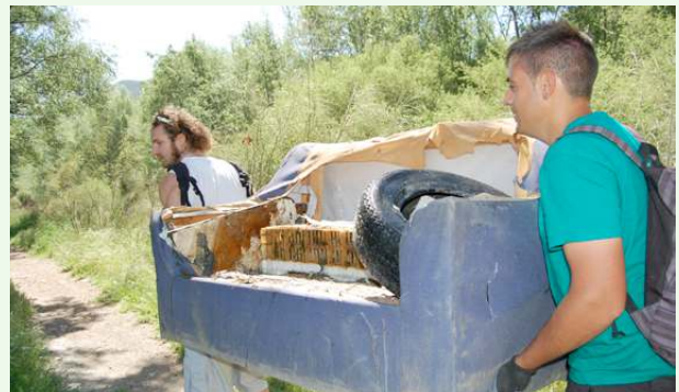
Voluntarios retirando residuos voluminosos

A nivel internacional se organizan otras campañas que van destinadas a su implementación local, por ejemplo, la Semana Europea de la Prevención de Residuos o el Word Cleanup Day (Día mundial de la limpieza).