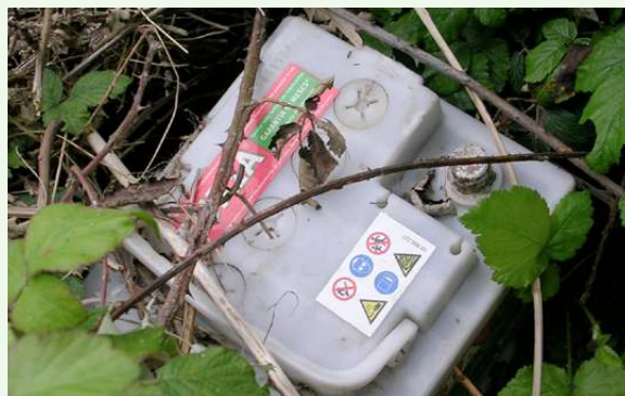
Residuo peligroso, cuidado con ellos

Aunque suene raro, pues nadie pide permiso para ensuciar, hace falta una autorización para hacer una limpieza . Es importante saber quién es el propietario de los terrenos y quién tiene la gestión ambiental. En el siguiente video se explica algo más sobre el tema.