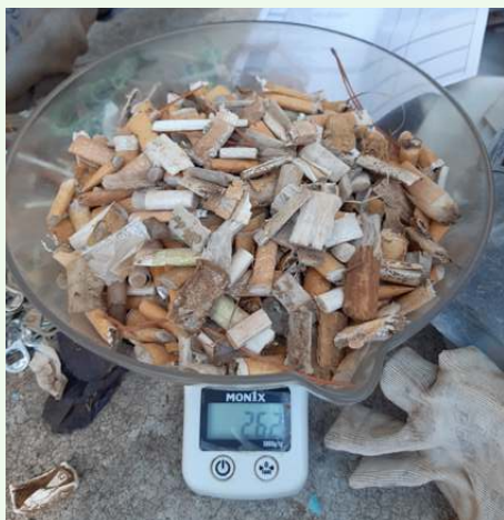
Pesando colillas para caracterización

La seguridad , ante todo. Hay que tener precaución con el tipo de terreno, cuidado con las caídas. Recomendamos el uso de guantes y tener en cuenta que hay residuos peligrosos. Disponer de un seguro de voluntariado nos dará más tranquilidad ante accidentes.